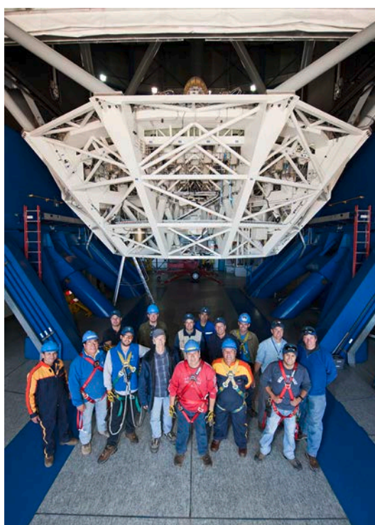
Fotografía grupal de ingenieros y staff de mantenimiento en el VLTI.

Los Miembros del Personal Local designados como Coordinadores de Emergencia en los observatorios, en ausencia del Ingeniero de Seguridad, durante fines de semana o permisos, recibirán una compensación equivalente a las condiciones que se aplican al servicio de llamada.