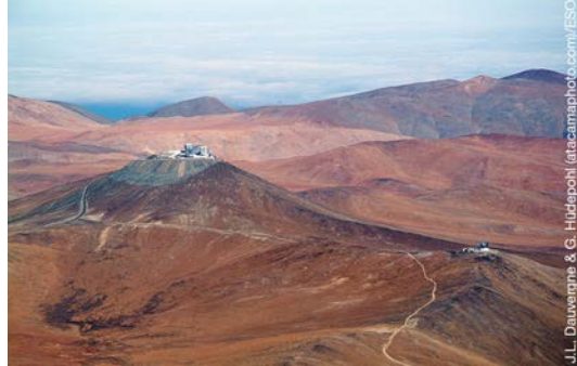
Vista Aérea del Observatorio Paranal.