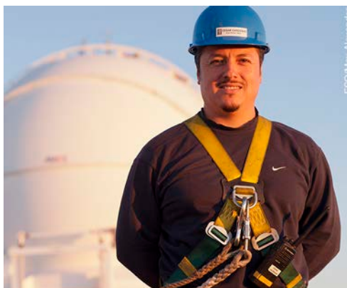
Técnico electrónico trabajando en el UTH.

Los Miembros del Personal Local asignados a un observatorio recibirán vestimenta y calzado de trabajo adecuados, según recomendaciones de la Comisión de Seguridad.