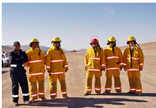
Brigada de Incendios de Paranal.